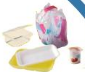
Autres emballages plastique