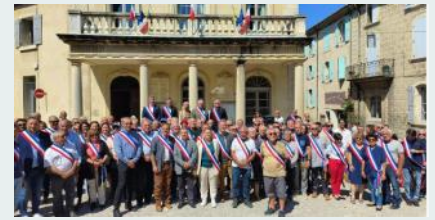
Rassemblement des Maires à Grignan