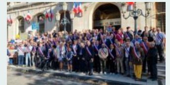
Rassemblement des Maires de la Drôme et de l'Ardèche