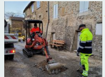
Réparation d'une rupture de canalisation le samedi 23/12, veille de réveillon de Noël.